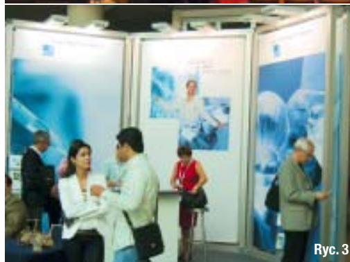
Ryc. 3 _ Stoisko informacyjne Fundacji Osteologii podczas wystawy produktów towarzyszącej Sympozjum.